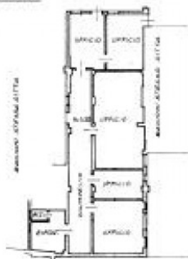
PIRELLA GÖTTSCHE LOWE